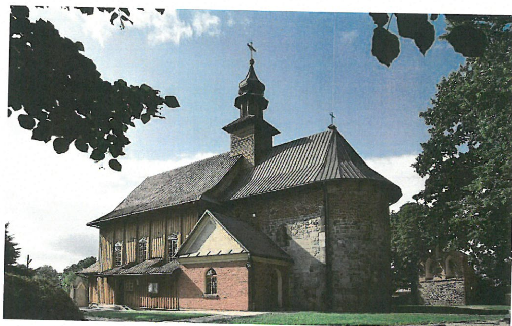
Kościół w Kościelcu Kaliskim

Wyjątkowym miejscem na szlaku kościołów drewnianych jest Kościół pw. św. Wojciecha w Kościelcu Kaliskim pochodzący najprawdopodobniej z I połowy XII wieku. Jego najstarsza zachowana część to romańskie, granitowe prezbiterium. Drewniana nawa świątyni zbudowana jest w stylu góralskim i pochodzi z XVIII wieku. Wyposażenie wnętrza stanowią cztery rokokowe ołtarze z połowy XVIII wieku oraz XVII-wieczny obraz św. Józefa w ołtarzu głównym.