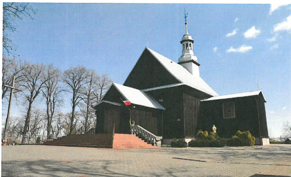
Kościół w Tłokini Kościelnej

Pod koniec XVII lub na początku XVIII wieku zbudowano obecnie istniejącą świątynię. W połowie XIX wieku dostawiono do niej kaplicę świętej Zofii. Kościół jest konstrukcji zrębowej, oszalowany. We wnętrzu dominuje styl barokowy. Ołtarz główny i boczne są przykładem tegoż stylu i pochodzą z drugiej połowy XVIII wieku.