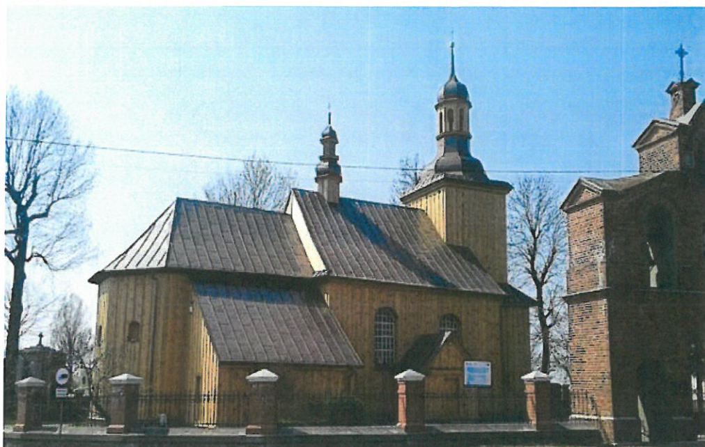
Kościół w Borkowie Starym