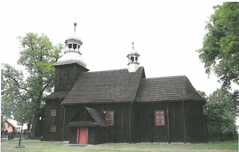
Kościół w Rychnowie

W sąsiedztwie Blizanowa znajduje się kościół parafialny pw. Wszystkich Świętych w Rychnowie, który istniał już przed rokiem 1433. Wzniesiony został z fundacji rodziny Rychnowskich. W 1755 roku świątynia została zniszczona przez burzę. Dopiero w 1782 roku Skowrońscy, nowi właściciele Rychnowa, wybudowali modrzewiowy kościół, który przetrwał do obecnych czasów. Świątynia zbudowana została w technice zrębowej, jest oszalowana, jednonawowa, z wieżą i wieżyczką-sygnaturką. Dach ma pokryty gontem, a wieżę i sygnaturkę blachą.