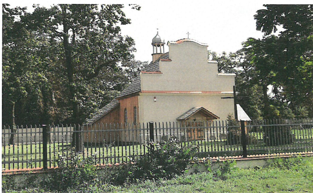
Kościół w Zborowie