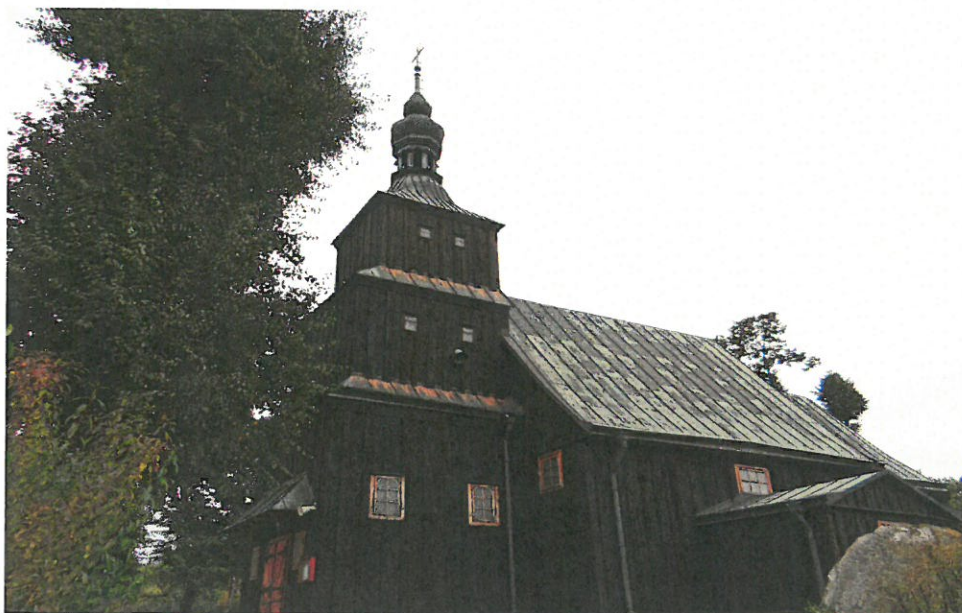
Kościół w Piątku Wielkim

Gmina Stawiszyn oprócz świątyni w Zbiersku może się również pochwalić zabytkowym kościołem pw. św. Marcina w Piątku Wielkim. Obecny kościół został zbudowany w 1740 roku dzięki krakowskiemu biskupowi Janowi Lipskiemu, po czym restaurowano go już w 1761 roku. Zlokalizowany jest na skraju parku pałacowego naprzeciwko dawnej XIX wiecznej rezydencji rodziny Szolców. Jest to przepiękny obiekt sakralny konstrukcji drewnianej. Na uwagę zasługuje trójkondygnacyjna, kwadratowa wieża z kruchtą w przyziemiu. Wysoki dach kryty jest blachą.