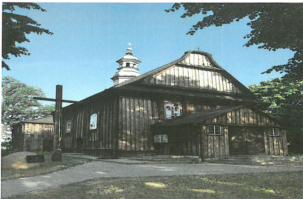
Kościół w Strzałkowie