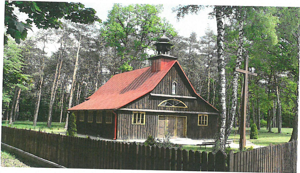
Kaplica w Krzyżówkach

Wędrując szlakiem kościołów drewnianych warto zobaczyć przepiękną drewnianą kaplicą pod wezwaniem Wniebowzięcia Najświętszej Marii Panny w miejscowości Krzyżówki. Kaplica znajduje się w lesie, przy drodze z Krzyżówek do Koźlątkowa. Obecna kaplica została umiejscowiona w tym miejscu na przedwojennych fundamentach.