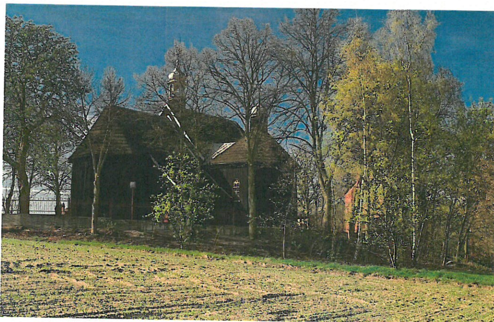
Kościół w Pamięcinie