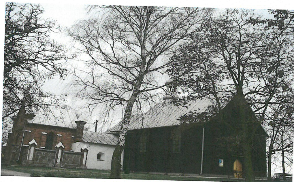
Kościół w Lipem