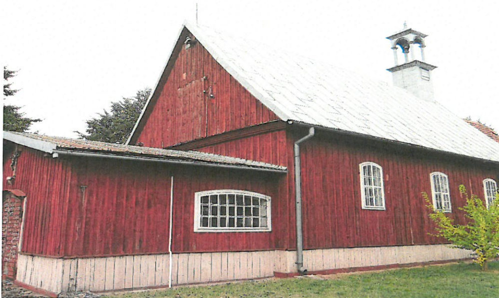
Kościół w Zbiersku