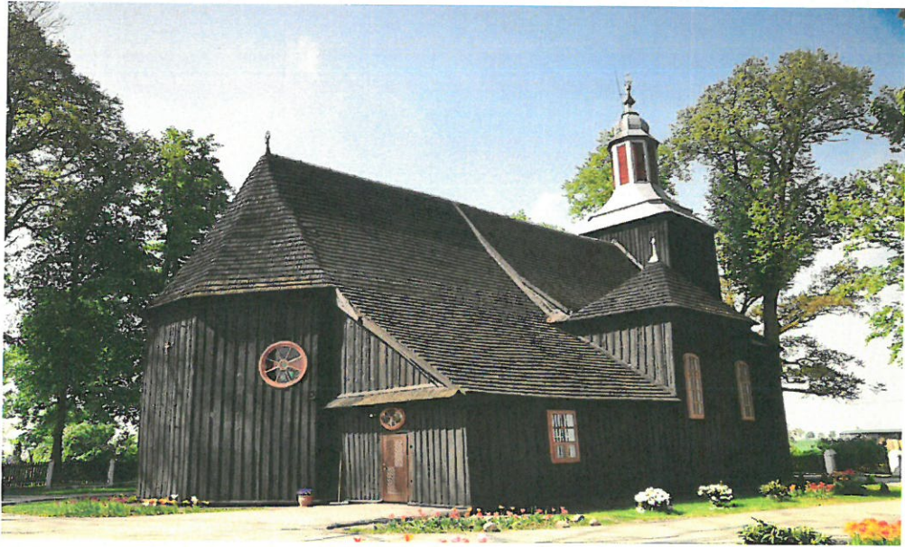
Kościół w Blizanowie